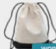
WOREK Z TROCZKAMI