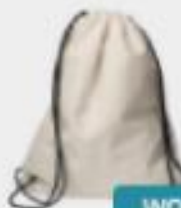
WOREK NA SZNURKACH