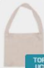
TORBA Z UCHEM