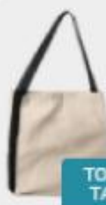
TORBA Z TASMĄ